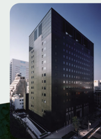
大阪サンライズビル