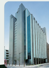
東京サンライズビル